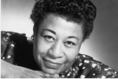
Ella Fitzgerald @jazznblues.club.wiki