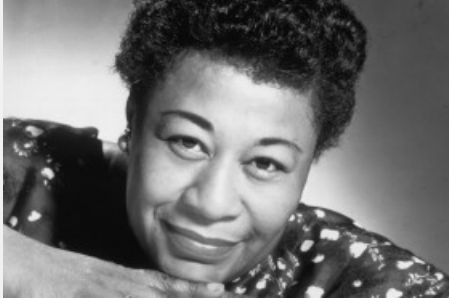
Ella Fitzgerald @jazznblues.club.wiki