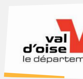
Conseil départemental du