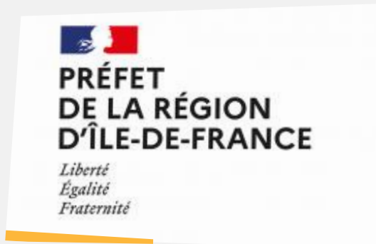
Direction Régionale des Affaires Culturelles d'Île-de-France