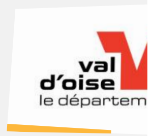
Conseil départemental du