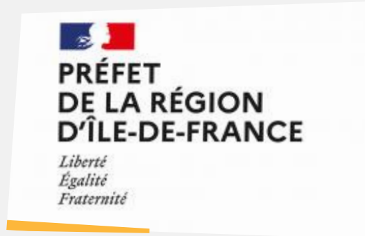
Direction Régionale des Affaires Culturelles d'Île-de-France