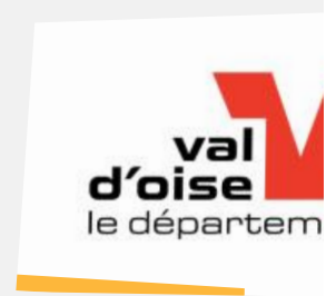
Conseil départemental du Val d'Oise