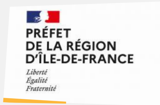
Direction Régionale des Affaires Culturelles d'Île-de-France